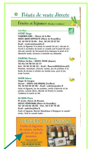
Exemple de pub ¼ de page

Je souhaite insérer une publicité dans « Le Carnet d'adresses bio en Pays Catalan » et je joins un chèque de 70 € à l'ordre du CIVAM BIO 66 (Différent du chèque de cotisation, SVP)